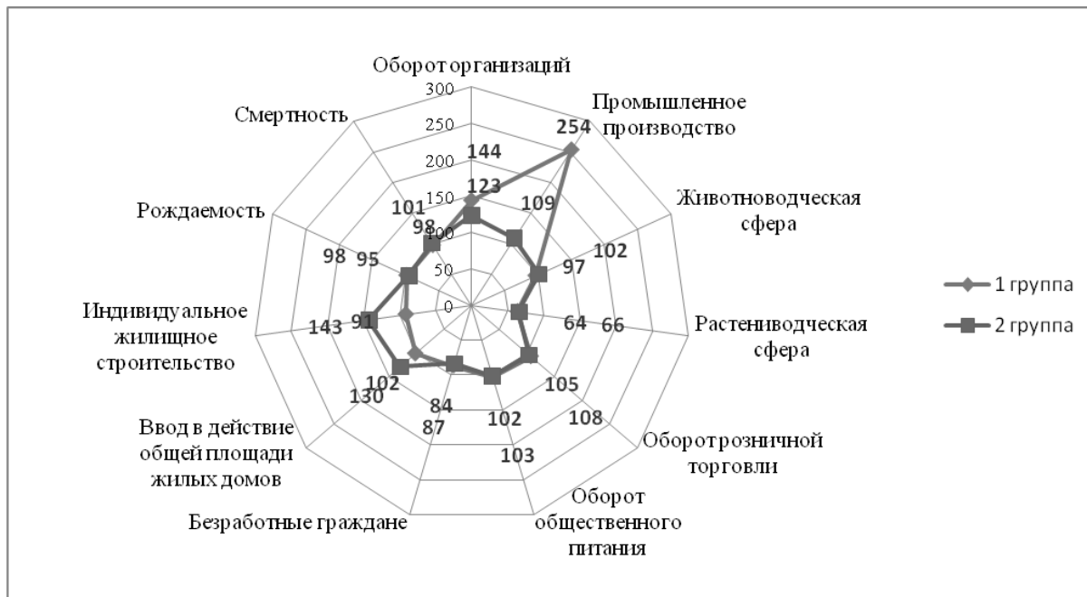
Рис. 1. Диаграмма средних значений показателей социально-экономического состояния муниципальных районов Ростовской области

В целом, анализ социально-экономического состояния муниципальных образований Ростовской области показал, что в 2011 г. по сравнению с 2010-м наблюдаются спад экономической активности в 12 муниципалитетах (28% исследуемой совокупности объектов), снижение производства сельскохозяйственной продукции (на 30% в сфере растениеводства на 25 территориях, в сфере животноводства на 23 территориях), численности населения (снижение рождаемости на 30 территориях, рост смертности на 21 территории).